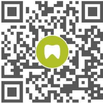
Abb. 1: QR-Code KulzerCOM.net