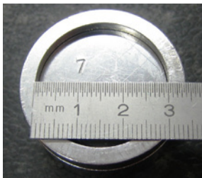
Prüfkörper mit Lineal.