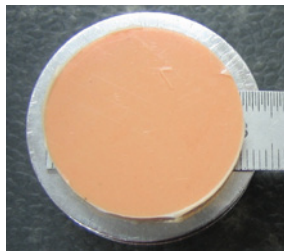
Schrumpfverhalten von xantasil nach mehreren Wochen.